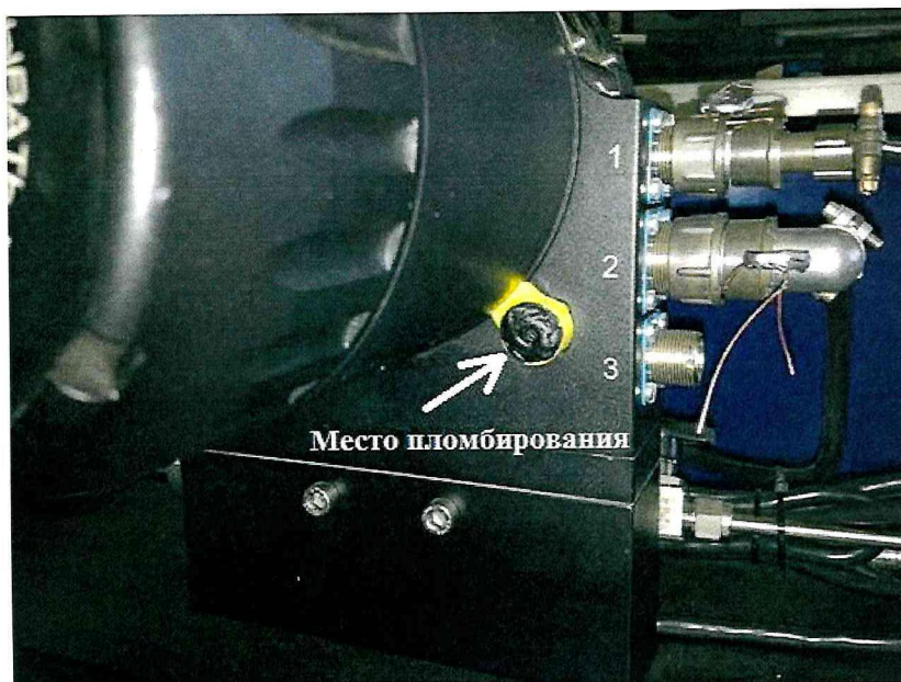
Рисунок 4 - Схема пломбирования блоков БЭР-005 (восьмиканальный) и БЭР-005-01 (четырёхканальный) КИУ «Вымпел-500»