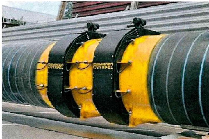
Рисунок 2 - КИУ «Вымпел-500» исполнение «02»